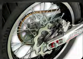
17" Supermoto Alu-Räder Wave-Bremsscheiben v/h